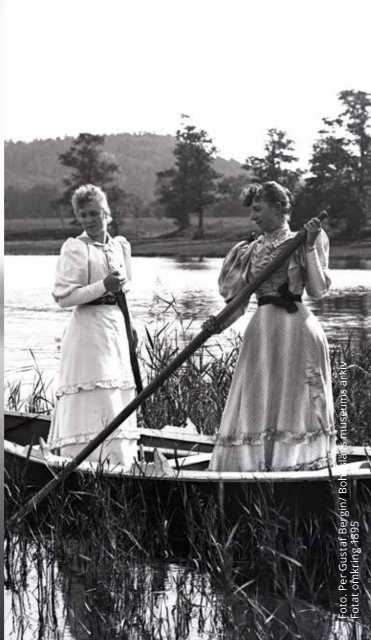
Fotat omkring 1895