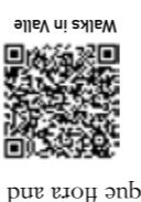
Walks in Valle

Between Skara and Billingen the inland ice has left behind a gentle, rolling landscape dotted with lakes. The area boasts numerous nature reserves with a wealth of unique flora and fauna. If you want to go hiking, there are 60 km of marked trails to explore. Most of the trails are marked with orange signs in the terrain, while some of them have their own symbols (see symbols on the map). The right of public access gives us the opportunity to hike freely in the nature, but also gives us the responsibility to never leave anything but footprints behind. Always close gates behind you and keep your dog on a leash while enjoying the beautiful nature in Valle. Regulations for each nature reserves is found on information signs by the reserves or at lansstyrelsen.se