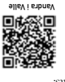
Vandra i Valle

Billingen – 58 km. Cår genom Vallbygdens på präbärgets Billingen. Vårerande vandring med vackra hagar och fina utsiktsplatser. Pilgrimsleden Falköping-Varnhem – 43 km. Cår genom kulturbild för två medeltida klosterruiner, en av Europas rikigaste fågelstjör och flera fornlämningar. Rosentigen – 2 km. Cår umed den porande Uundabäcken i Varnhem. Skyltar umed leden berättar om de platser man passerar. Pilgrimsleden Skara-Husaby – 26 km. Cår mellan två imponerande kyrkor. Skara domkyrka och Husaby kyrka. Lärvandrad led som också går genom den grönskande Söbodalen. Tempelbackalen – 1,8 km. Stadsnära och familjevänlig vandringstid utanför Skara. Missa inte fornlämningarna vid Tempelbacken som även utgör en fin picknickplats.