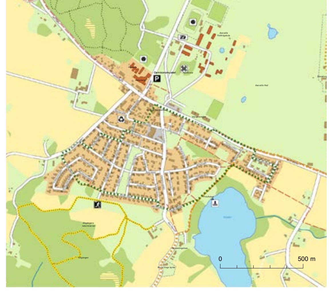
Kartorna är framtagna av Skara kommun 2023. Bakgrundsmaterial: Topografiska webbkartan.